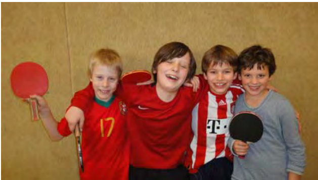
Mini-Meister Jungen, Jahrgänge 2002/03