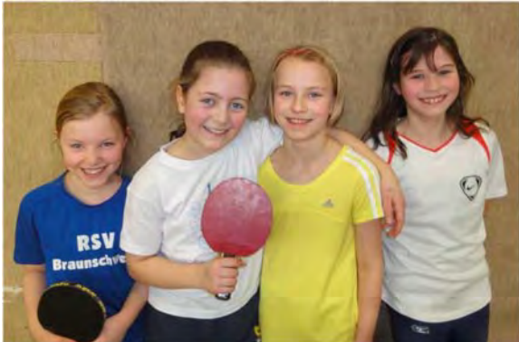
Mini-Meister Mädchen, Jahrgänge 2002/03

Teilnehmer der Altersgruppe 2000/01 waren nicht dabei.