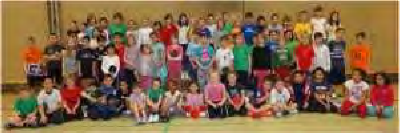
Teilnehmer der Minimeisterschaften (Aus Datenschutzgründen war eine bessere Bildqualität nicht zulässig)

Zum 17. Mal hat der RSV Braunschweig in Kooperation mit der Grundschule Klint den Ortsentscheid der TT-Minimeisterschaften ausgerichtet. Zu diesem Großereignis meldeten aus den 2., 3. und 4. Klassen ca. 70 Jungen und Mädchen in den Altersklassen 02, 03, 04 und jünger. Die Erstklässler wurden dieses Jahr nicht mit in die Meisterschaft aufgenommen. Sie erhielten in der eigens für sie entwickelten „TT-Mini-Olympiade“ die Möglichkeit, in einem Koordinations-Parcours und kleinen Übungen am Tisch ersten Kontakt mit dieser Sportart aufzunehmen (siehe Bericht unter 2.1).