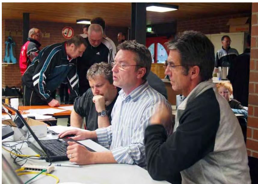
Organisationsteam des MTV Othfresen bei der konzentrierten Arbeit mit der neuen MKTT-Turnierssoftware.

Vereinswertung: 1. VfL Oker, 2. MTV Othfresen, 3. MTV Vienenburg, 4. TSG Bad Harzburg, 5. MTV Bettingerode, 6. TSV Liebenburg, 7. TSV Rhüden, 8. TTV Göttingerode, 9. MTV Goslar, 10. TSG Wildemann.