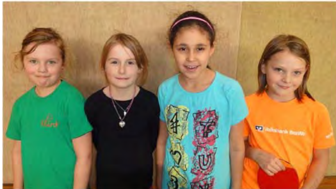
Mini-Meister Mädchen, Jahrgänge 2004/05