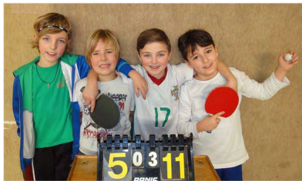
Mini-Meister Jungen, Jahrgänge 2004/05