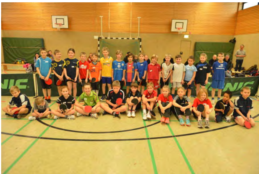
Teilnehmer in Braunschweig

Trainingsergebnisse und Empfehlungen der regionalen Stützpunkttrainer ist von dort aus der Sprung in das Leistungssportsystem des TTVN und damit in den landesinternen D-Mini-Kader möglich.