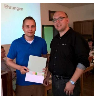
VTTC Concordia Braunschweig