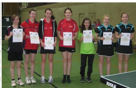
Weibliche Jugend ? Es gab keine Bildbeschreibung !