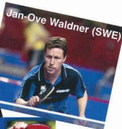
Jan-Ove Waldner (SWE)