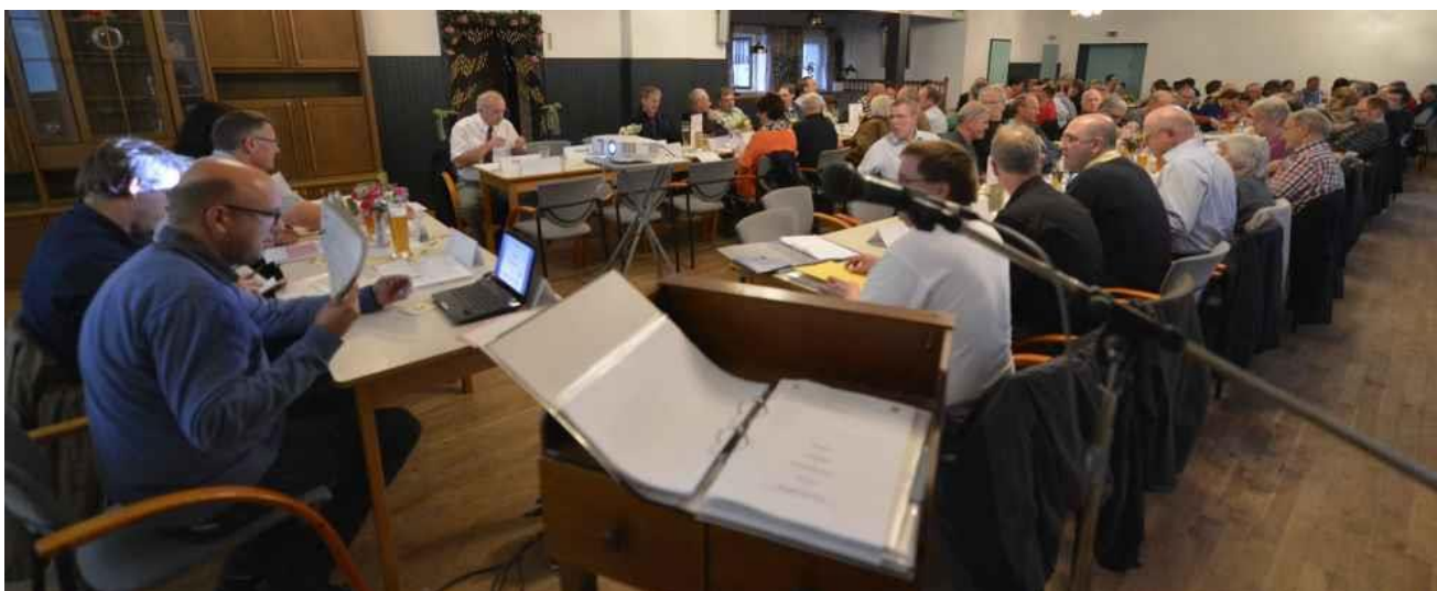
Der gefüllte Saal der Gaststätte Rote Wiese 9, 38124 Braunschweig am 30. September 2014