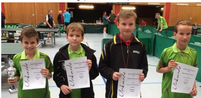
Schüler B Einzel (v.li.n.re.)