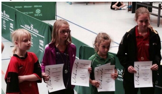
Schülerinnen B, Doppel (v.re.n.li.)