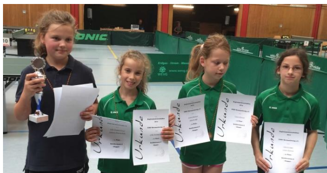
Schülerinnen C, Einzel (v.li.n.re.)