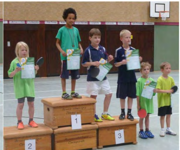
Jungen 2005 und jünger (16 Teilnehmer)