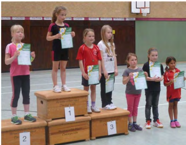
Mädchen 2005 und jünger (16 Teilnehmer)