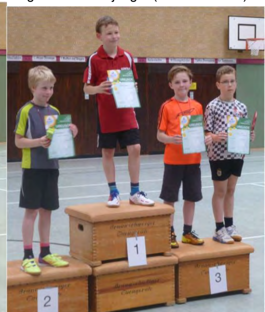
Jungen 2003/04 (12 Teilnehmer)