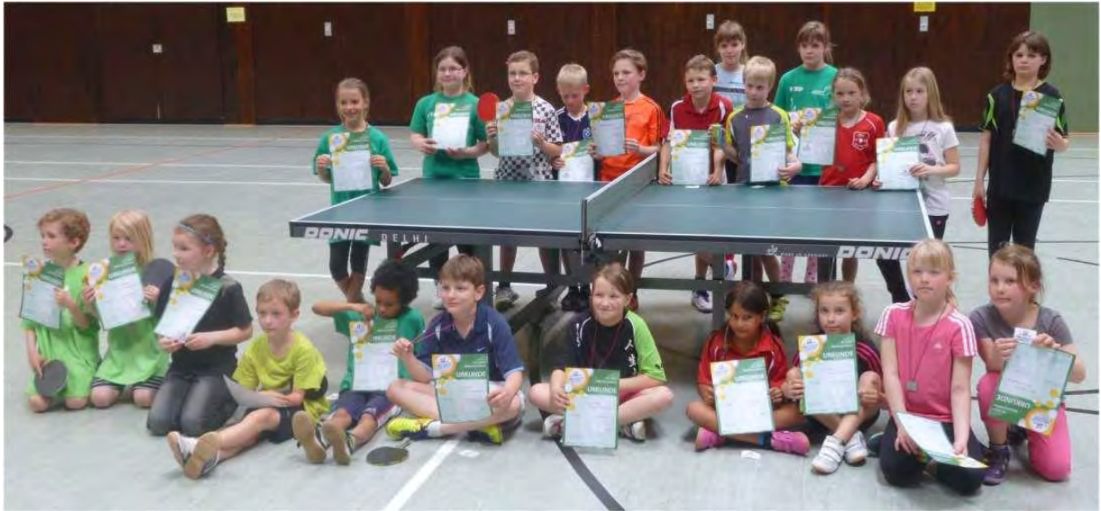
Die Plätze 1 – 4 alle 4 Altersgruppen