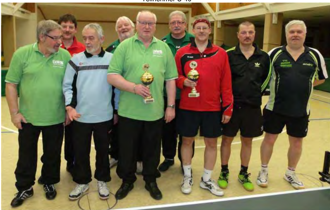
Sieger Ü-40 und 60

Bericht und Bilder von Thomas Beck ( Kreispressewart)