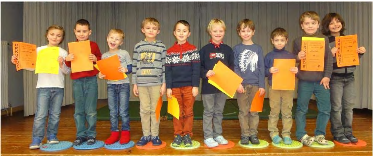
Die Top 10 der Jungen bei der Siegerehrung in der Aula der GS Klingt.