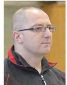
Nebojsa Stevanov Landestrainer

Kinder, die nicht zur 2. Stufe eingeladen werden, haben aber die Chance, in den Bezirksstützpunkten aufgenommen zu werden. Durch gute Trainingsergebnisse und Empfehlungen der regionalen Stützpunkttrainer ist von dort aus der Sprung in das Leistungssportsystem des TTVN und damit in den landesinternen D-Mini-Kader möglich.