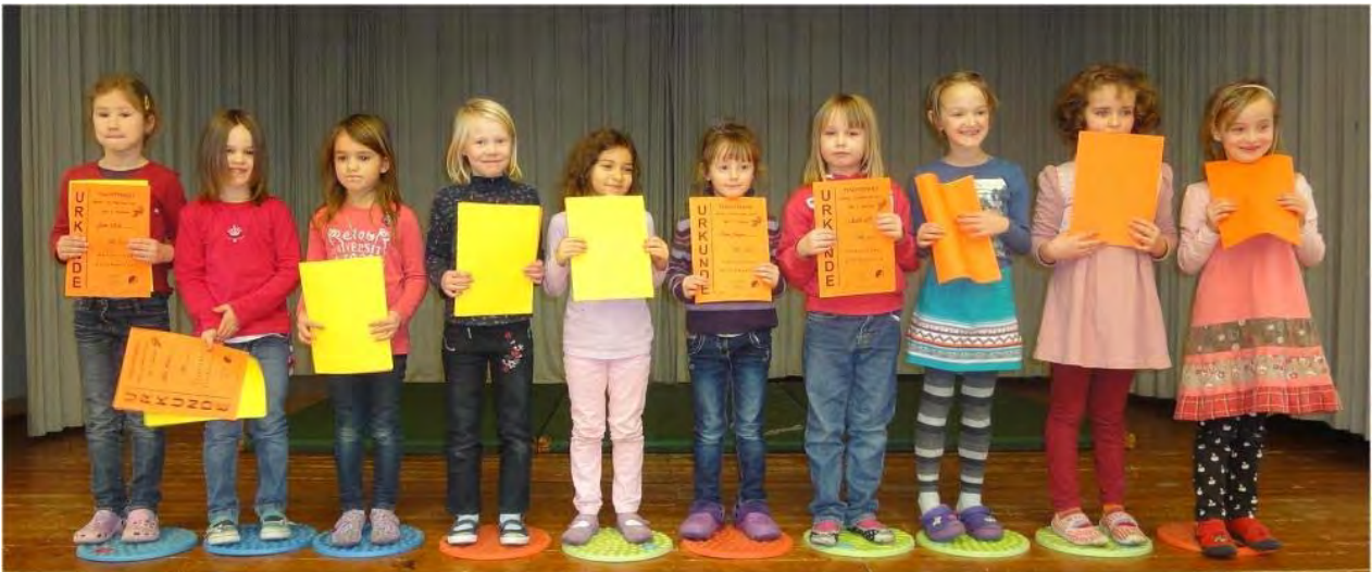
Die Top 10 der Mädchen bei der Siegerehrung in der Aula der GS Klingt.