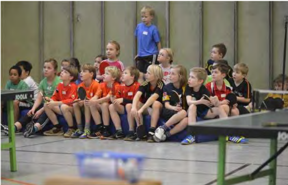
Die 22 Teilnehmer in Braunschweig 2014

Der Ablauf gliederte sich in in den Phasen Organisatorisches (Anmeldung, Aufbau, Infos für Kinder und Eltern), Koordinationsübungen, Tischtennis-Schlagarten, Aufwärmübungen, Wettkampf und Abschlusserläuterungen.