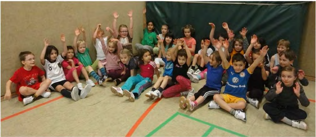
Teilnehmerinnen und Teilnehmer der Gruppe A